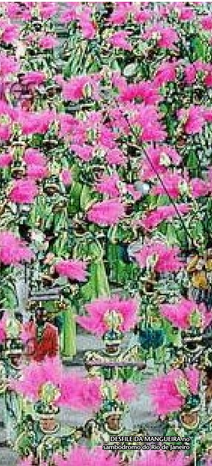
DESFILE DA MANGUEIRA no sambódromo do Rio de Janeiro

Não se pode afirmar, também, com certeza, qual é a origem da palavra, mas existem duas versões mais aceitas quanto ao seu significado. A primeira afirma que a palavra Carnaval vem de carrus navalis , os carros navais com enormes tonéis de vinho que durante as Bacanais , festas em honra a Baco (deus dos ciclos vitais, da alegria e do vinho, conhecido entre os gregos como Dionísio), era distribuído ao povo em Roma.